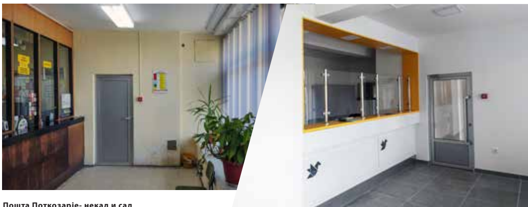
Пошта Поткозарје- некад и сад

Посебан значај ове инвестиције огледа се у чињеници да Пошта 75453 Папраћа