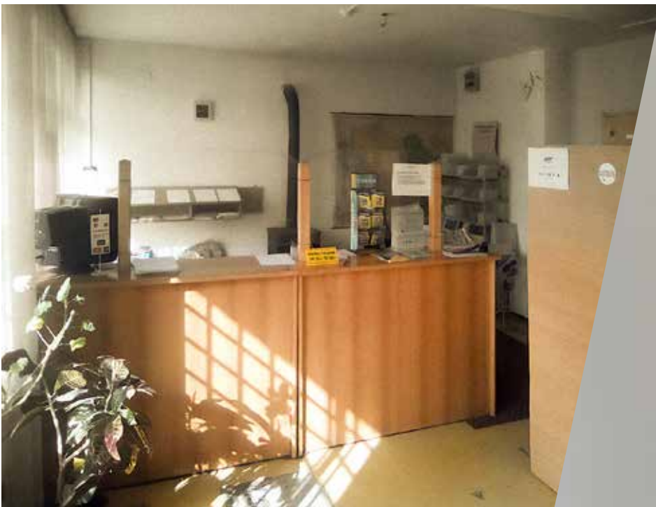
Пошта Папраћа - некад и сад